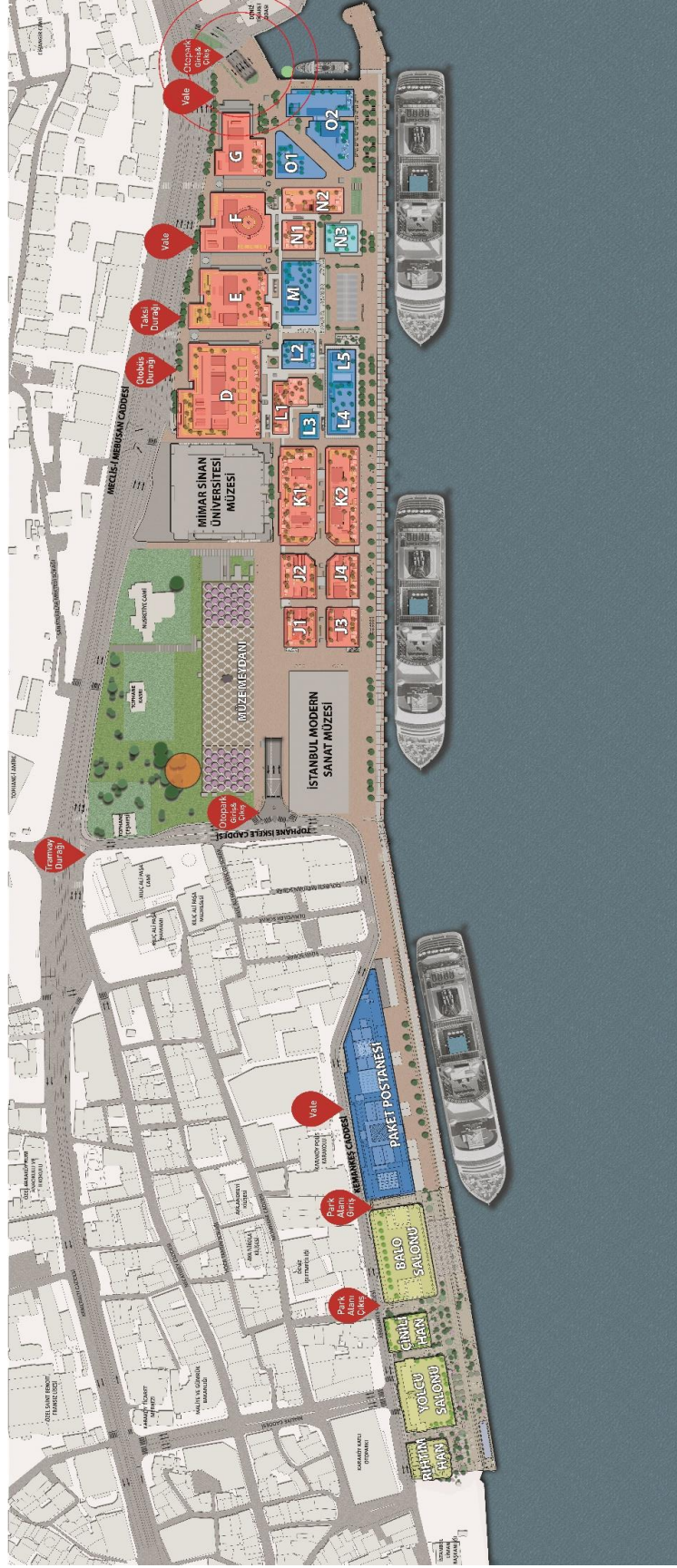
Ek-1 Fındıklı P1 Otoparkı Giriş Kroki (Kırmızı daire ile belirtilen alan)