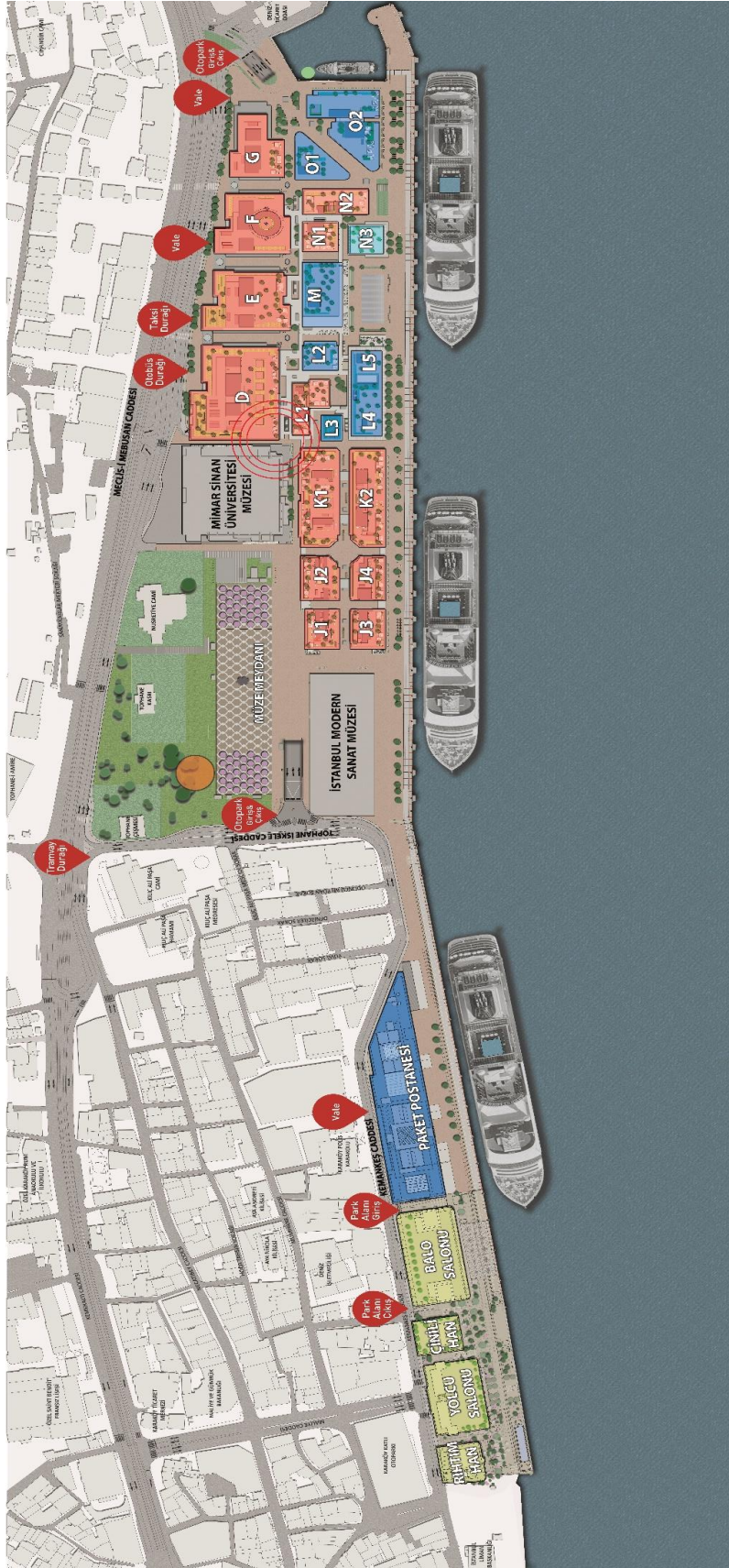
Ek-4 D Binası Terminal Yaya Yolcu Giriş Çıkışı