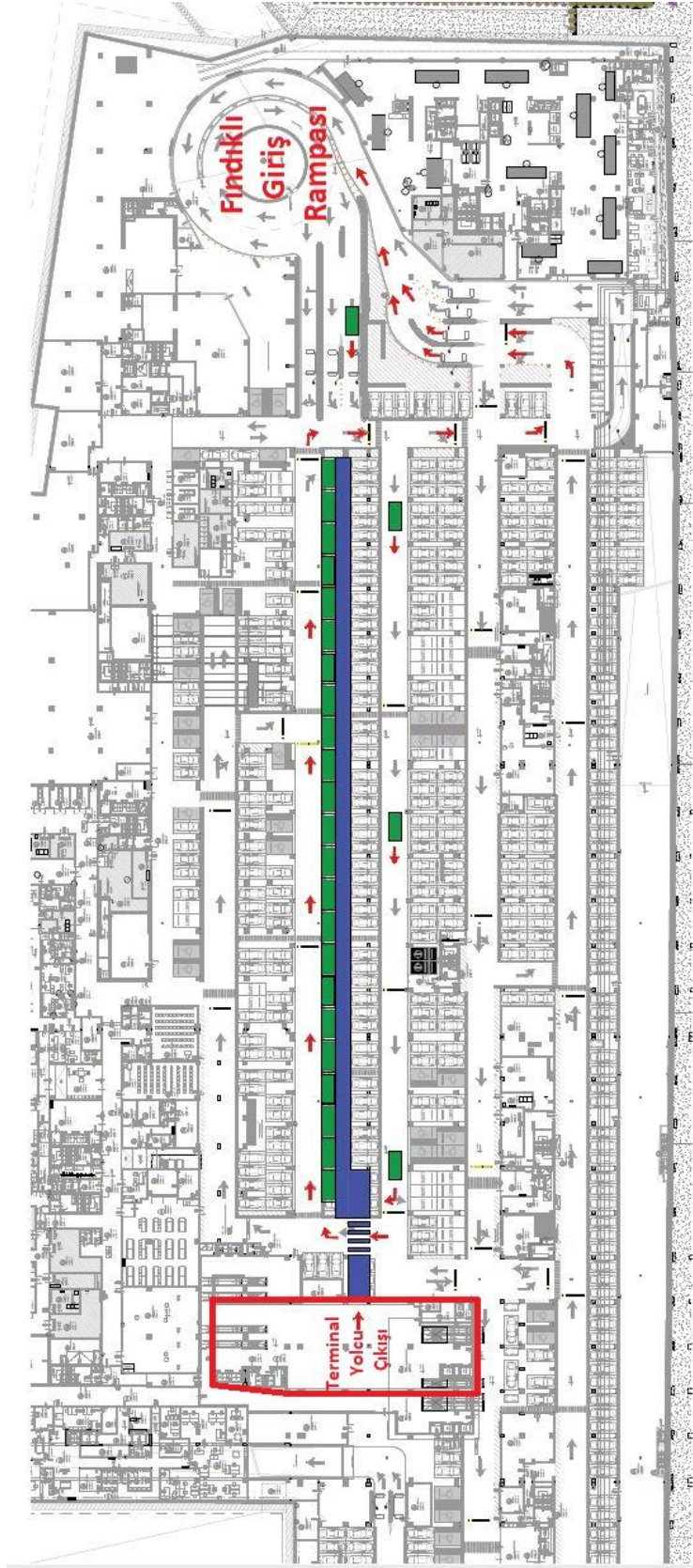
Ek-2 P1 Otopark Sirkülasyonu